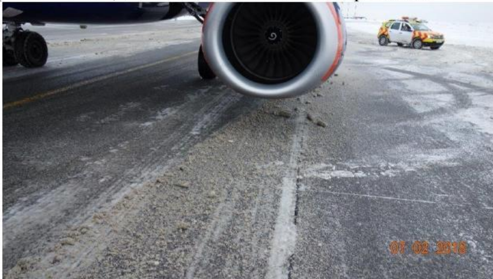
Пример некачественной очистки искусственных покрытий в аэропорту Шереметьево

наличие на ВПП и рулежных дорожках слякоти, а также необъективная информация о виде, площади и толщине слоя загрязнений.