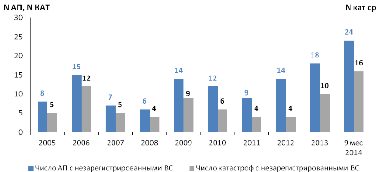
Рис. 2. Абсолютные показатели безопасности полетов незарегистрированных ВС